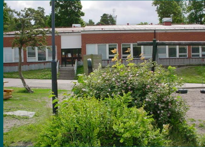
Förskoleklasserna finns på Rubinen på Björklinge skola.

Förskoleklassen börjar klockan 08.00 den 17 augusti 2023. Det finns tre förskoleklasser på Björklinge skola och en förskoleklass på Skuttunge skola.