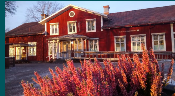
På Skuttunge skola är Förskoleklassen i röda huset.

Förskoleklassen börjar klockan 08.00 den 17 augusti 2023. Det finns tre förskoleklasser på Björklinge skola och en förskoleklass på Skuttunge skola.